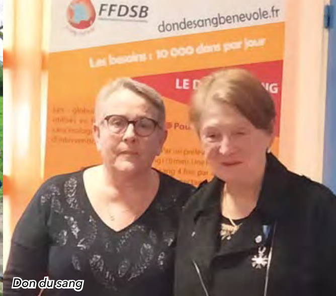
Don du sang

pompe restauré du village ont récemment été inaugurés.