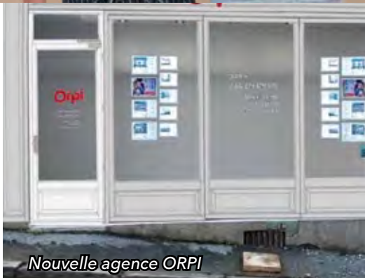
Nouvelle agence ORPI