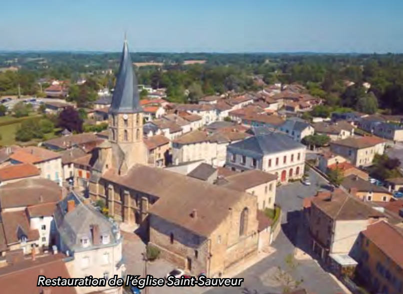
Restauration de l'église Saint-Sauveur