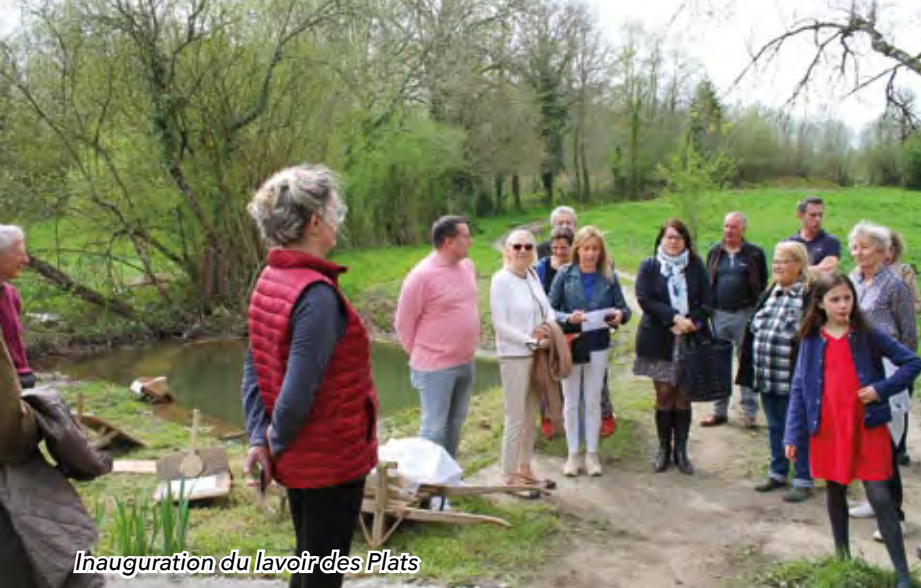
Inauguration du lavoir des Plats